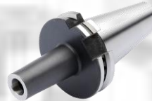
Fräseraufnahmen für Einschraubfräser