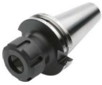
Spannfutter für Spannzangen DIN 6499 (ISO 15488) System ER