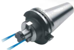
Quernut-Aufsteckfräserdorne DIN 6357 mit vergrößerter Anlagefläche und Kühlkanalbohrungen an der Stirnseite