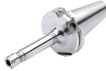
Spannfutter für Spannzangen DIN 6499 (ISO 15488) System ER