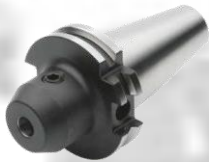
Fräseraufnahme DIN 6359 für Zylinderschäfte DIN 1835-B