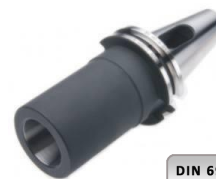
Zwischenhülsen für MK mit Austreiblappen DIN 6383